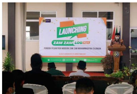
Figure 1: Launch of "LOGMART"

This emphasises the uniqueness of modern Islamic boarding schools, which utilise technological instruments, data, and information to become essential sources of access for Islamic boarding school development (Hafidz, 2021). Data development in the retail business will help ensure that the supply of goods is more guaranteed in terms of quality, quantity and timeliness.